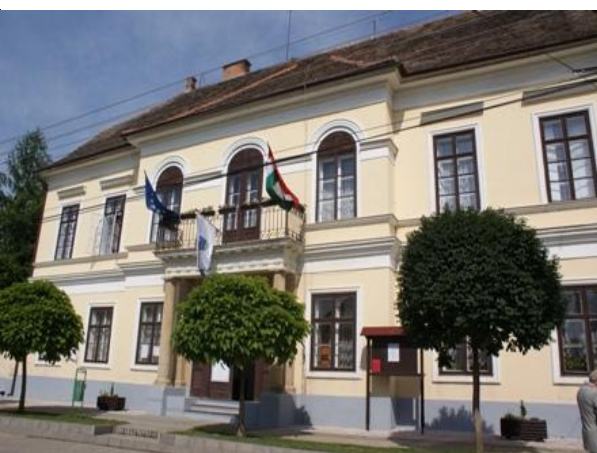
(Kardoss-Kastély) mai Polgármesteri Hivatal